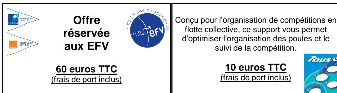
Tableau « Tous en Course » (Bon de commande en pièce jointe)

Beach Flags Complet (Bon de commande en pièce jointe)